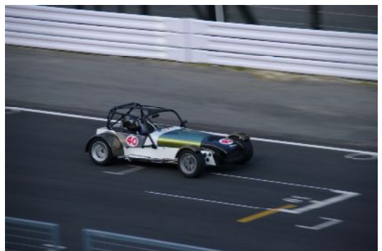
西車優勝トヒストリック